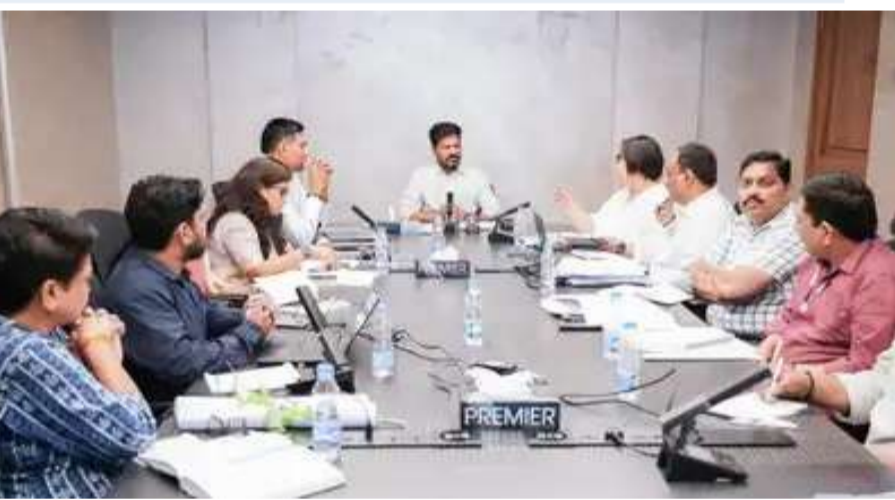
హైదరాబాద్: ప్రధాన వగరాలు, పట్టణ ప్రాంతాలను వృద్ధి కేంద్రాలుగా మార్చడంలో భాగంగా మెగా గ్రోత్ కాలిడార్ ప్రణాళికపై ముఖ్యమంత్రి రేవంత్ రెడ్డి అధికారులతో సమీక్షించారు. భవిష్యత్ అవసరాలను దృష్టిలో పెట్టుకొని పట్టణ అభివృద్ధికి బాటలు వేసేలా కీలక నిర్ణయాలు తీసుకున్నారు. ఖమ్మం, వరంగల్, కలీంగర్ కార్పొరేషన్లకు జెటర్ లింగ్ రోడ్డు విగ్నాన్.. 26