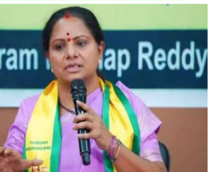
హైదరాబాద్: మంత్రి సీతక్క తెలంగాణ రక్షణ సేన (టీఆర్ఎస్) అధ్యక్షులు కల్వకుంట్ల కవిత కీలక విజ్ఞప్తి చేశారు. ఆమె జరుగుతున్న అక్రమాలపై స్పందించాలని కోరారు. స్త్రీనిధిలో అక్రమాలకు విగ్నాన్.. 26