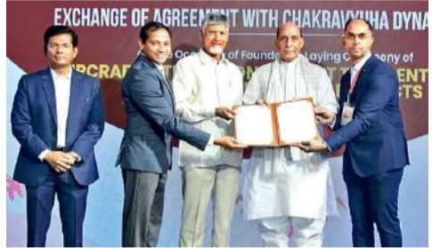
ఆంధ్రప్రదేశ్ను దేశ రక్షణ రంగ పటంలో అగ్రస్థానంలో నిలుపుతూ, రాష్ట్ర చరిత్రలోనే ఒక చారిత్రక అధ్యాయానికి కేంద్ర ప్రభుత్వం శ్రీకారం చుట్టింది. ఆనంతపురం జిల్లా పుట్టపర్తి వేదికగా శుక్రవారం వేల కోట్ల రూపాయల విలువైన వాల్యుమ్ కీలక రక్షణ రంగ ప్రాజెక్టులకు కేంద్ర రక్షణ శాఖ మంత్రి రాజ్ నాథ్ సింగ్, ఏపీ సీఎం చంద్రబాబుతో కలిసి శంకుస్థాపన చేశారు. ఈ కార్యక్రమం కేవలం మిగతా 2లో

రక్షణ ఉత్పత్తి, ఎగుమతుల్లో భారత్ అపూర్వ వృద్ధి సాధించింది పుట్టపర్తిలో వేల కోట్ల విలువైన భారీ రక్షణ ప్రాజెక్టులకు శంకుస్థాపన ముఖ్యమంత్రి చంద్రబాబు నాయకత్వం, విజన్ పై రాజ్ నాథ్ సింగ్ ప్రశంసల వర్షం ఏపీని దేశానికే రక్షణ హబ్ గా మార్చే ప్రణాళికలో భాగంగా కీలక అడుగులు కర్నూలులో డ్రోన్ సిటీ ఏర్పాటుకు 8 కంపెనీల సంయుక్త ప్రయత్నం