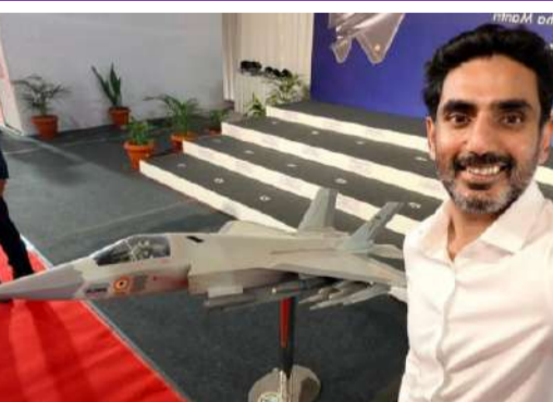
ప్రధానమంత్రి నరేంద్ర మోడీ, కేంద్ర రక్షణ శాఖ మంత్రి రాజ్ నాథ్ సింగ్, ఆంధ్రప్రదేశ్ ముఖ్యమంత్రి చంద్రబాబు.. వీరంతా 75 ఏళ్ల కుర్రాళ్లు అంటూ మిగతా 2లో

పుట్టపర్తిలో ఏఎంసీపీ స్టెల్ థైటర్ జెట్ ప్రాజెక్టుకు భూమిపూజ మోడీ, రాజ్ నాథ్, చంద్రబాబు 75 ఏళ్ల కుర్రాళ్లు వారిలో 25 ఏళ్ల యువకులు ఉన్నారని, వారి స్పీడ్ తట్టుకోలేం