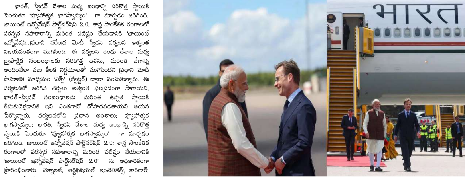
రెడ్డిపై చేయాలనే ప్రతిష్టాత్మక లక్ష్యాన్ని నిర్దేశించుకున్నారు. ఈ సందర్భంగా స్వీడన్ ప్రధాని ఉల్ఫ్ క్రిస్టెర్సన్ తో పాటు స్వీడన్ ప్రభుత్వం, అక్కడి ప్రజలు తమపై చూపిన ఆదరాభిమానాలకు, స్వేచ్ఛాపూర్వక వాతావరణానికి ప్రధాని నరేంద్ర మోదీ ప్రత్యేక కృతజ్ఞతలు తెలియజేశారు.