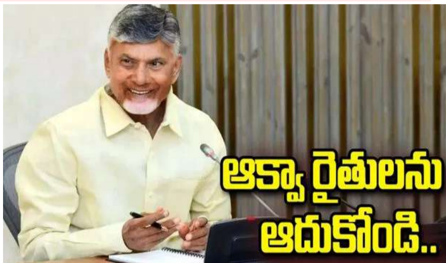
అమరావతి: ఆంధ్రప్రదేశ్లోని ఆక్యా, పొగాకు రైతులు ఎదుర్కొంటున్న తీవ్ర సమస్యలపై ముఖ్యమంత్రి చంద్రబాబు నాయుడు దృష్టి సారించారు. వారిని ఆదుకునేందుకు చర్యలు తీసుకోవాలని కోరుతూ కేంద్ర ప్రభుత్వానికి వేర్వేరుగా లేఖలు రాశారు. రొయ్యల మేత ధరల పెరుగుదల, మిగతా..2లో