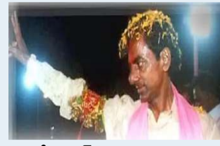
కరీంనగర్ సింహగర్జన సభ

ప25.. కేటీఆర్ ప్రత్యేక పాస్స్ హైదరాబాద్: తెలంగాణ ప్రత్యేక రాష్ట్ర సాధనలో కీలక సభ అయిన కరీంనగర్ సింహగర్జన సభకు 25 ఏళ్లు నిండాయి. ఈ మేరకు అప్పటి పీపీఎస్ కింగ్స్ ను ట్యాగ్ చేస్తూ భారత రాష్ట్ర సమితి కార్యనిర్వాహక అధ్యక్షుడు కేటీఆర్ ఎక్స్ వేదికగా పాస్స్ చేశారు. 2001 మే 17న జరిగిన సింహగర్జన నుంచి ఇటీవలే పూర్తయిన రజతోత్సవ వేడుకల వరకు బీఆర్ఎస్ పార్టీ అదే జోషిలో ఉందని అన్నారు. కనుమూపు మేరల్లో అంశా అంధకారం, అన్నీ అపసవ్యమై, గత కాలపు గాయాలు.. ధనం బలం లేదు.. రాజకీయ బలం లేదు. అయినా సింహగర్జన సభకి జనం పోడితిన విషయాన్ని కేటీఆర్ గుర్తు చేసుకున్నారు. తనను కన్నభూమి తెలంగాణ.. ఎందుకీలా గోస వదుతుందన్న ఆవేదన, మాతృభూమిపై గుండెల నిండా పొంగే తెలంగాణ ప్రేమ, రాష్ట్రాన్ని సాధించాలన్న నిండ్లైన పట్టుదల, ప్రజలు అందగా ఉంటారన్న భరోసా.. ఈ నాలుగే ఉద్యమ నాయకుడు కేటీఆర్ను నడిపించిన నాలుగు రథ చక్రాలని కేటీఆర్ ఎక్స్ వేదికగా పేర్కొన్నారు.