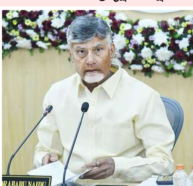
అమరావతి: గ్రామీణ ప్రాంతాల్లో ప్రజలకు అత్యాధునిక సాంకేతికతతో వైద్య సేవలు అందించే

★ రోగి నమోదు నుంచి మందుల పంపిణీ వరకు డిజిటల్ ప్రక్రియను పరిశీలన ★ ఏవ ఆధారిత వైద్యం, వర్చువల్ కన్సల్టింగ్ విధానాలను ప్రత్యక్షంగా వీక్షించిన సీఎం ★ సాంకేతికతతో వైద్యులకు డాక్యుమెంటేషన్ భారం తగ్గి రోగులపై శ్రద్ధ పెరిగిందని వెల్లడి ★ కుష్టుం, బెంగళూరు నిపుణులతో వర్చువల్ కాన్ఫరెన్స్ నిర్వహణ