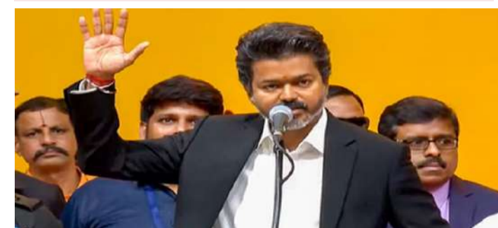
తమిళనాడు: తమిళనాడులో గృహ శుభవార్త చెప్పింది. రాష్ట్రంలో ఉచిత విద్యుత్ వినియోగదారులకు ప్రభుత్వం విద్యుత్ పథకాన్ని మిగతా 2 లో

తమిళనాడులో 200 యూనిట్ల ఉచిత విద్యుత్ పథకం అమలుకు రంగం సిద్ధం వచ్చే బిల్లింగ్ సైకిల్ నుంచే ఈ పథకాన్ని వర్తింపజేయనున్న ప్రభుత్వం