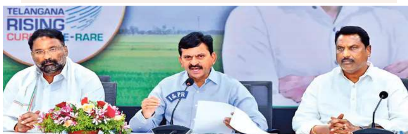
క్యూర్ పరిధిలో పేదలకు లక్ష గృహాలు మాలమూరుకు రూ.587 కోట్లు

కూర్ పరిధిలో పేదలకు లక్ష గృహాలు 25 లక్షల ఇందిరమ్మ ఇళ్లు.. మాలమూరుకు రూ.587 కోట్లు హైదరాబాద్: తెలంగాణలో పేదల ఇళ్ల నిర్మాణానికి పెద్దపీట వేయాలని రాష్ట్ర మంత్రి మండలి నిర్ణయించింది. పూరిగిడిపేట తేలి అదర్శ రాష్ట్రంగా తెలంగాణను తీర్చిదిద్దాలని మిగతా 2 లో