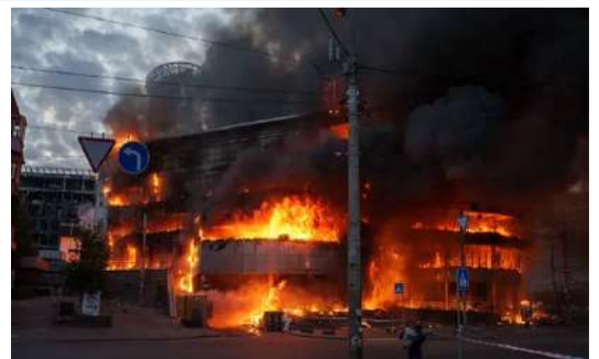
కీవ్: ఉక్రెయిన్పై రష్యా పెద్ద ఎత్తున దాడులు చేసింది. కొన్ని మండల ప్రాంతాల్లో క్షిపణులను ప్రయోగించింది. కీవ్ నగరంతో పాటు దాని చుట్టుపక్కల ప్రాంతాల్లో నలుగురు మృతిచెందగా, మరో 50 మందికిపైగా మిగతా 2 లో

ఇళ్లకు, పాఠశాలకు నష్టం వాటిల్లినట్లు సమాచారం ఒరెష్కె హైపర్ సోనిక్ క్షిపణి శబ్ద వేగం కన్నా 10 రెట్లు ఎక్కువ వేగంతో ప్రయాణిస్తుంది కీవ్ బయట చెర్యాపీ, ఖాల్కవ్, క్రోపీవ్, ఓడెసా, పోల్టవా, సుమీ, జైటోమిర్ ప్రాంతాలపైనా దాడులు