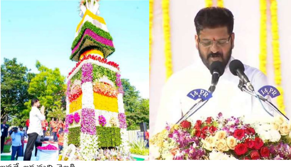
సీఎం రేవంత్ రెడ్డి పేర్కొన్నారు. దానికి తెలంగాణ రైజింగ్ 2047 విజన్ దాక్కుమంటే మార్గమని తెలిపారు. 2034 నాటికి 1 ట్రిలియన్ డాలర్లు. మిగతా 2 లో