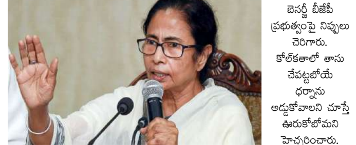
పశ్చిమ బెంగాల్: పశ్చిమ బెంగాల్ మాజీ ముఖ్యమంత్రి, తృణమూలీ కాంగ్రెస్ అధినేత్రి మమతా ధైర్యముంటే నన్ను అరెస్ట్ చేసుకోండి అంటూ పోలీసులకు బహిరంగంగా సవాల్ విసిరారు. మిగతా 2 లో

కోర్కెకాలో ధర్మాకు పిలుపునిచ్చిన మమతా బెనర్జీ ధర్మాకు అనుమతి నిరాకరించిన పోలీసులు అనుమతి ఇవ్వకపోయినా ధర్మా నిర్వహిస్తామన్న మమత