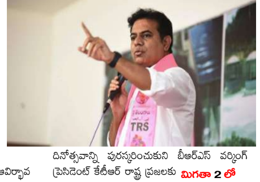
దినోత్సవాన్ని పురస్కరించుకుని బీఆర్ఎస్ వర్గం ప్రెసిడెంట్ కేటీఆర్ రాష్ట్ర ప్రజలకు మిగతా 2 లో

తెలంగాణ ప్రగతి, ప్రజల సంక్షేమనే లక్ష్యంగా బీఆర్ఎస్ పని చేసిందని వ్యాఖ్య తెలంగాణ అస్తిత్వానికి రక్షణ కవచంలా నిలబడిందన్న కేటీఆర్ హైదరాబాద్: తెలంగాణ రాష్ట్ర 12వ ఆవిర్భావ