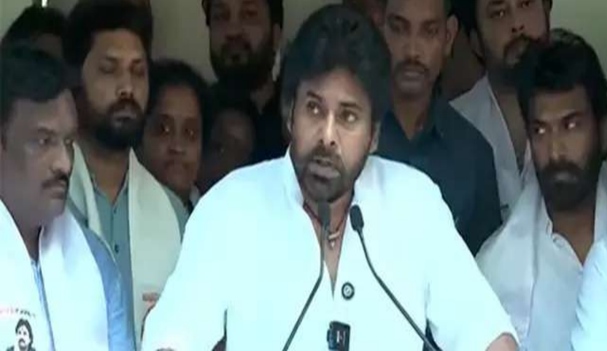
హైదరాబాద్: "ఇప్పటి వరకు నిర్ణయించుకోలేదు. మీరు అంటున్నారు గనక చెబుతున్నా తెలంగాణలో జనసేన ఉంటుంది. మేం ఇక్కడ పోటీ చేస్తాం. అవసరమైతే తెలంగాణలో నేనే తిరుగుతాను. మేమే తిరుగుతాం. మిగతా 2 లో

హైదరాబాద్ లో సభ.. జనసేనకు హైకోర్టులో చుక్కెదురు! హోస్ మోషన్ బిల్ షిఫ్ట్ మంత్రి తిరుస్కరించిన న్యాయస్థానం సాయంత్రం మీడియా సమావేశం నిర్వహించును. సవన కల్యాణ్ హైదరాబాద్ లో సభను తీవ్రంగా వ్యతిరేకించిన పార్టీలు