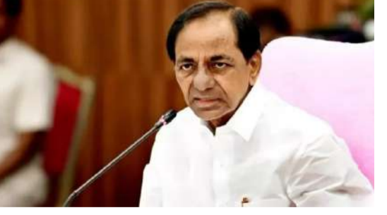
హైదరాబాద్: జూన్ 2 తెలంగాణ రాష్ట్ర ఆవిర్భావ దినోత్సవాన్ని పురస్కరించుకుని బీఆర్ఎస్ అధినేత, ఉద్యమ నాయకుడు మిగతా 2 లో

అసమానతలు, అవమానాలు, అణిచివేతల నుండి తెలంగాణ ప్రజలకు విముక్తి లభించిన రోజు జూన్ 2 కేసీఆర్ నాయకత్వంలోనే పోరాడి సాధించుకున్న తెలంగాణ రాష్ట్ర ప్రగతి ప్రస్థానానికి నాంది పడింది ప్రస్తుత రాజకీయ పరిణామాల నేపథ్యంలో పార్టీ శ్రేణులు, ప్రజలు అప్రమత్తంగా ఉండాలి