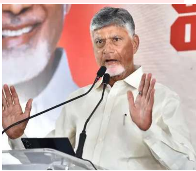
నిరుద్యోగులను దగా చేశారని, తాము అధికారంలోకి వచ్చాక దాదాపు మగతా 2 లో

అంటే ఏమిటో తెలియని వ్యక్తులు డీఎస్సీ నియామకాలపై బురద జల్లే ప్రయత్నం చేస్తున్నారని చంద్రబాబు తీవ్రస్థాయిలో మండిపడ్డారు. పశ్చిమగోదావరి జిల్లా ఆవంట మండలం సిద్ధాంతంలో నిర్వహించిన 'మీ భూమి - మీ హక్కు' కార్యక్రమంలో పాల్గొన్న ఆయన, వైసీపీపై తీవ్ర విమర్శలు చేశారు. గత పాలకులు జాబ్ క్యారెండర్ ఇస్తామని చెప్పి